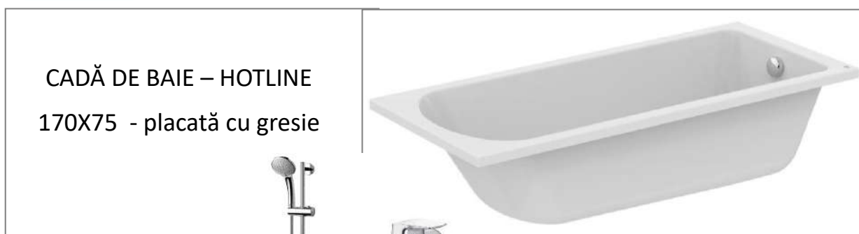
CADĂ DE BAIE – HOTLINE 170X75 - placată cu gresie