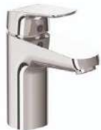
Baterie lavoar Ceraflex Ideal Standard