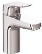
Baterie lavoar Ceraflex Ideal Standard